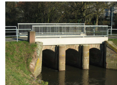
N49° 20.612' E8° 31.461'